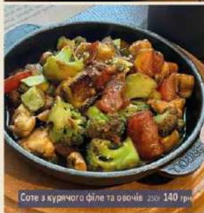
Соте з курячого філе та овочів 250г 140 грн