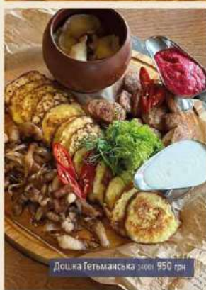
Дошка Гетьманська 950 грн