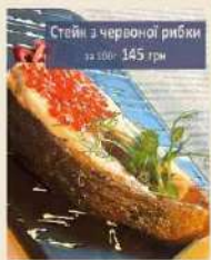
Стейк з червоної риби 100г 145 грн