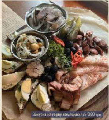
Закуска на гарну компанію 350 360 грн