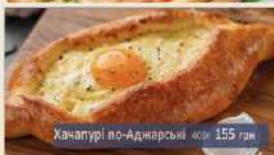
Хачапурі по-Адjarський 155 грн