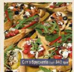
Сет з брускетів 340 грн