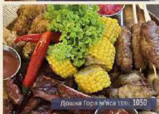
Дошка Гора м'яса 1300г 1050