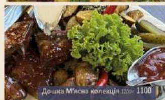
Дошка М'ясна колекція 1200г 1100