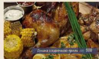
Дошка з курячою-гриль 1600г 980