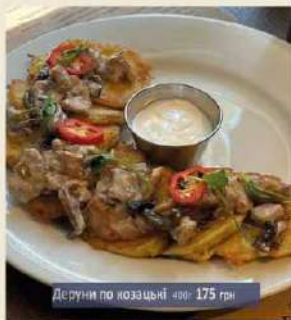
Деруни по козацьки 400г 175 грн